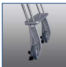
Piedino con ruota