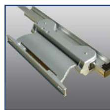
Carrello con snodo