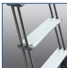
Particolare gradino con attacco