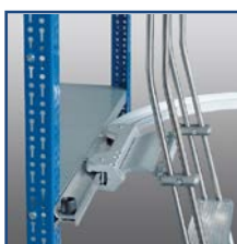
Curva binario per scorrimento carrello