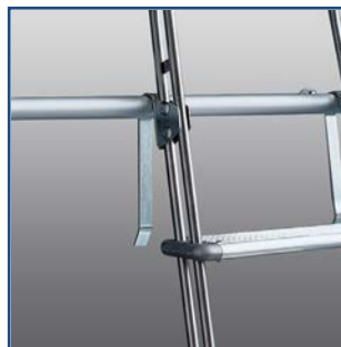
È possibile regolare i ganci in altezza dall'ultimo gradino fino alla curvatura del montante