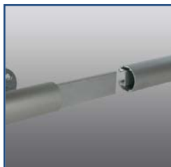
Innesto unione binario