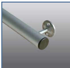
Particolare distanziale per fissaggio binario e tappo di chiusura